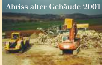
Abriss alter Gebäude 2001