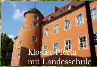
Kloster Pforta mit Landesschule