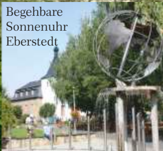
Begehbare Sonnenuhr Eberstedt