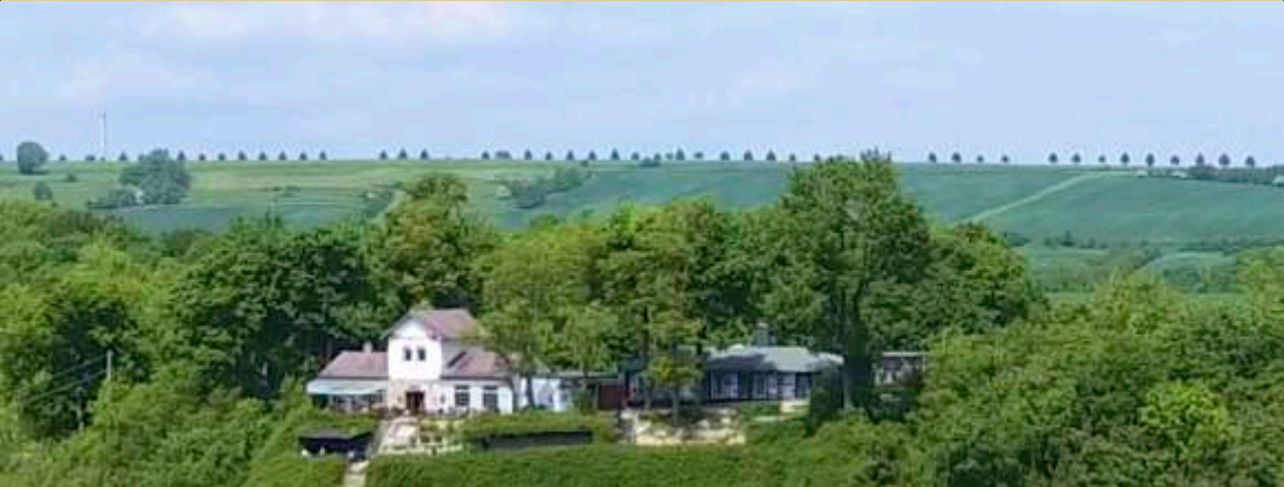
Himmelreich Bad Kösen