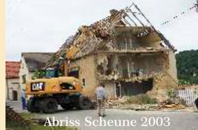
Abriss Scheune 2003