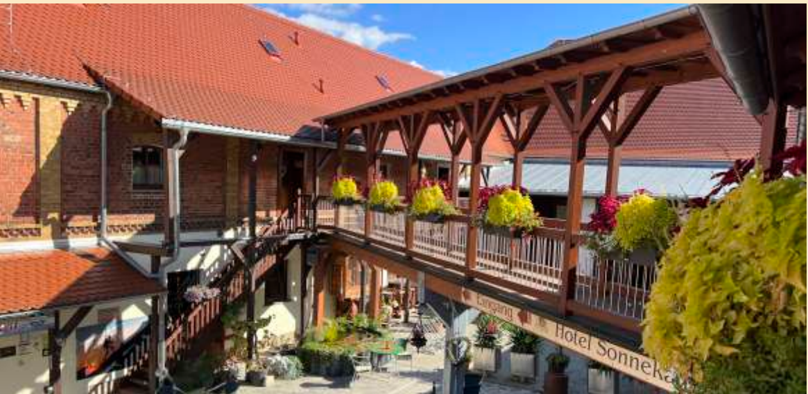
Mit Biergarten -- direkt am Radweg

helfen Ihre wertvolle Urlaubszeit noch besser gestalten zu können. Mit Freizeit- und Sportmöglichkeiten, interessanten Neuigkeiten, Veranstaltungen, und natürlich attraktiven Buchungsangeboten im Paket. Egal wie Sie sich hier auch fortbewegen möchten als Wanderer/in oder Radfahrer/in auf den Radwegen an Ilm und Saale, welche direkt an unseren Haus vorbei laufen oder per Bahn, Bus oder PKW. Wir helfen Ihnen gern bei der Planung Ihres Ausfluges. Sprechen Sie uns an. Genießen Sie regionale Produkte und Entdecken Sie die Vielfalt des Saale - Unstrut-Weines in seinen verschiedenen Facetten. Die unterschiedlichen Lagen und Böden machen ihn zu einem einzigartigem Genuss.