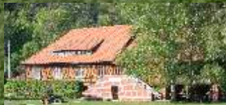
Gradierwerk Bad Sulza